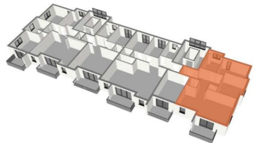
Lage im Geschoss