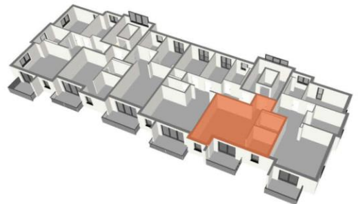
Lage im Geschoss