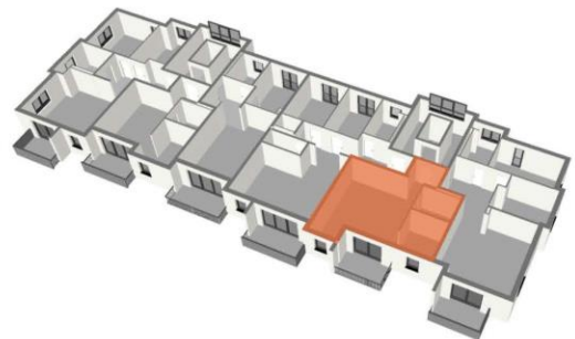
Lage im Geschoss